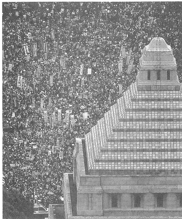
安保法反対デモ・国会前に10万人以上が終結 (2015年8月30日)

「自衛隊員は普段から、自衛隊の医療機関で精神科を受診すれば『この隊員は精神的に弱い』とのレ